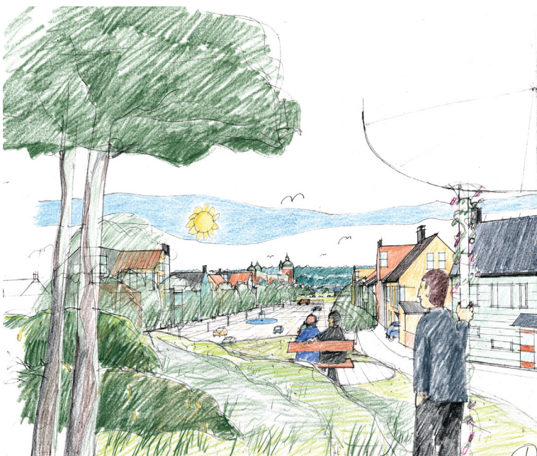
VY FRÅN KULLEN NORR OM TORGET